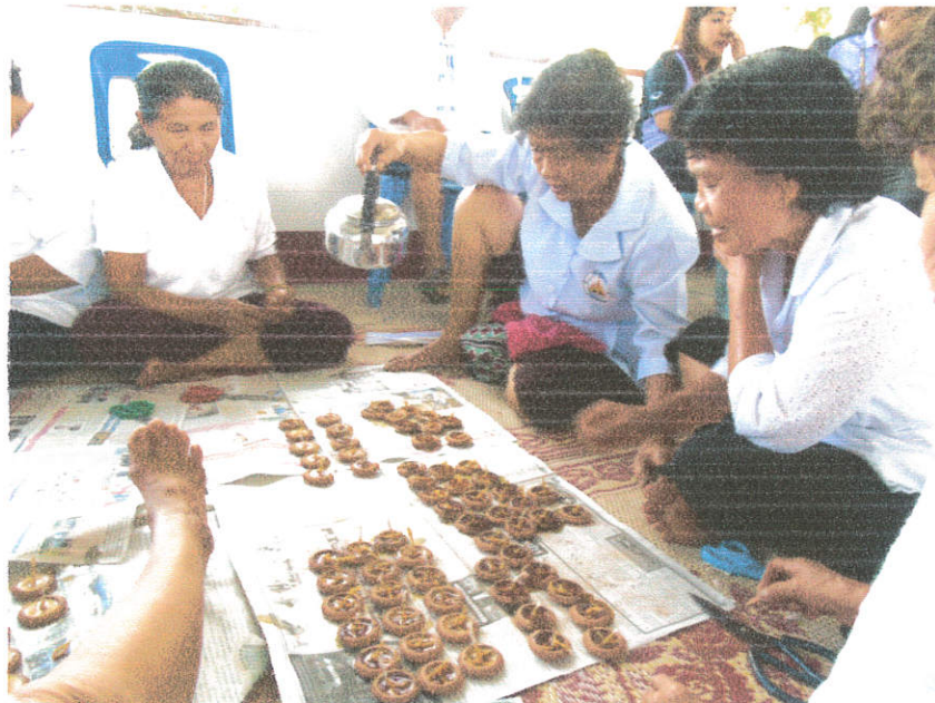
๓. กิจกรรมร่วางมาตรฐานคนสามวัย