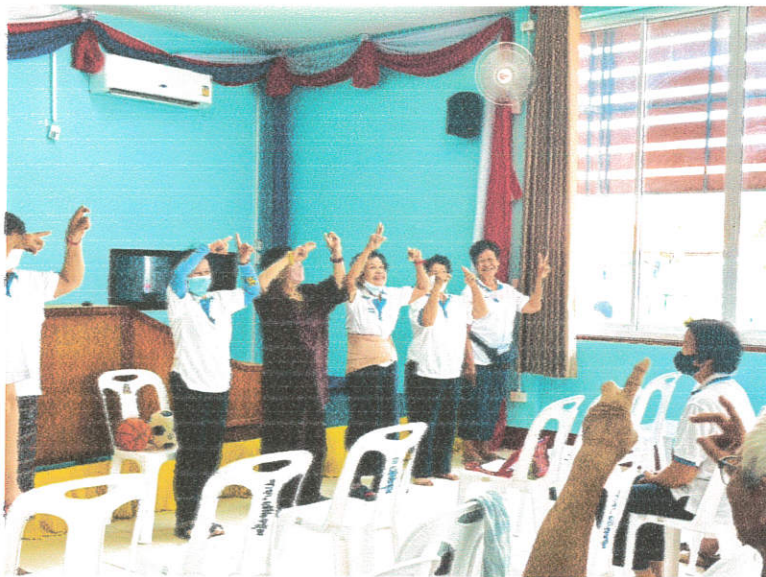
กิจกรรมส่งเสริมการออกกำลังกายง่ายๆ โดยใช้ไม้พลอง