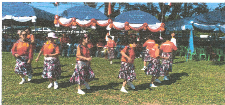
๔. การแสดงศิลปะพื้นบ้านประจำถิ่นคนสามวัย